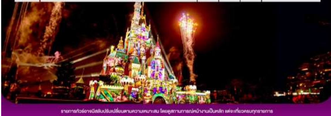
รายการทัวร์อาจมีปรับเปลี่ยนตามความเหมาะสม โดยดูสถานการณ์นำงานเป็นหลัก แต่จะเที่ยวครบทุกรายการ