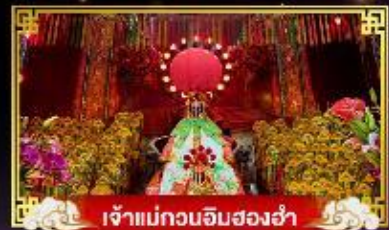
เจ้าแม่กวนอิมสองอ่า