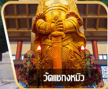
วัดเขangkงหวี