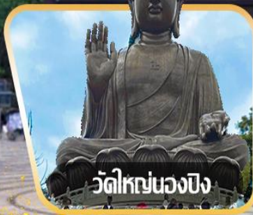
วัดใหญ่หนองปิง