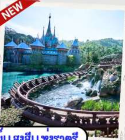
“MOMENTOUS” มหึศจรรย์ขบวนแสงสีแห่งราตรี