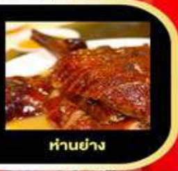
ห่านย่าง