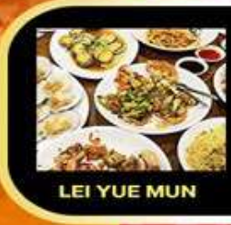
LEI YUE MUN