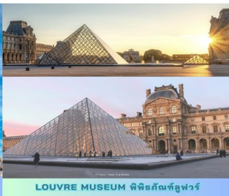
LOUVRE MUSEUM พิพิธภัณฑ์ลูฟวร์