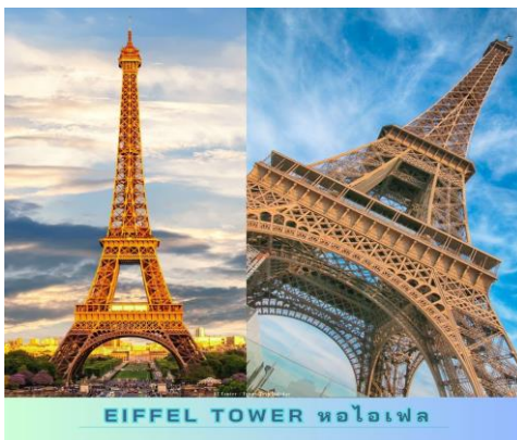
EIFFEL TOWER หอไอเฟล

นำท่าน ชมและถ่ายภาพหอไอเฟล เป็นหอคอยโครงสร้างเหล็ก ที่มีความสูงสง่าถึง 212 เมตร