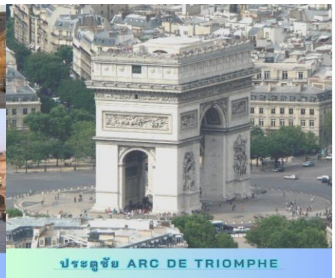
ประตูชัย ARC DE TRIOMPHE