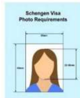
ตัวอย่างรูปถ่าย