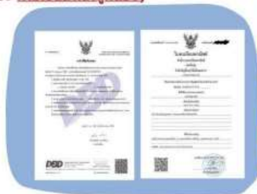
ตัวอย่างหนังสือจดทะเบียนบริษัท และ ใบทะเบียนพาณิชย์