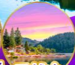
ทิกิเซ่ ปาด่า