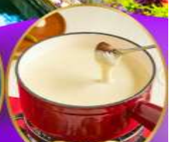
ฟองดูชีส