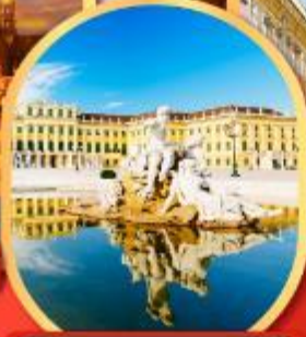
พระราชวังซินบรูนน์