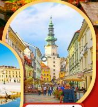
บราติสลาว่า