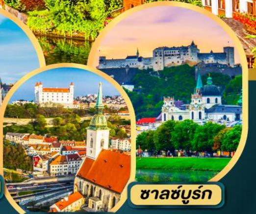
ซาลซ์บูร์ก