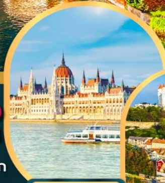
ส่องเรือแม่น้ำดานูบ