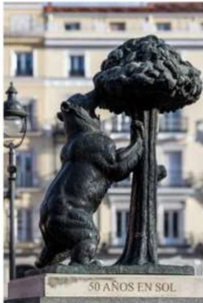
50 AÑOS EN SOL