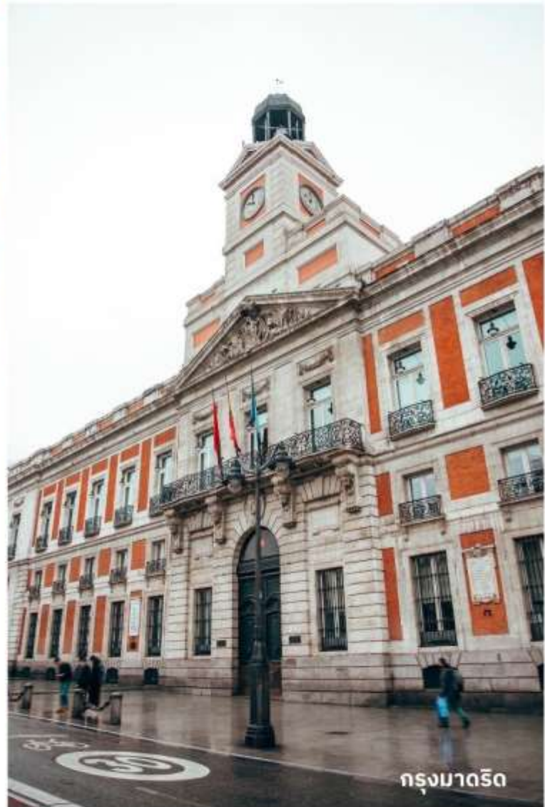
กรุงมาดริด