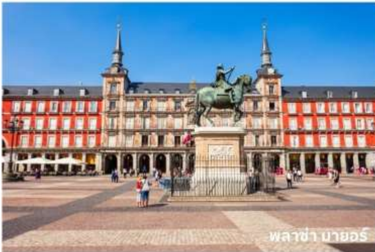
พลาซ่า มายอร์

จากนั้นนำท่านเดินทางสู่ กรุงมาดริด (Madrid) เมืองหลวงของประเทศสเปน ตั้งอยู่ใจกลางแหลมไอบีเรีย ในระดับความสูง 650 เมตร เป็นมหานครอันทันสมัยล้ำยุคที่กษัตริย์ฟิลลิปที่ 2 ได้ทรงย้ายที่ประทับจากเมืองโทเลโดมาที่นี้และประกาศให้มาดริดเป็นเมืองหลวงใหม่ ยกเว้นในช่วงประมาณปี ค.ศ. 1601-1607 เมื่อพระเจ้าฟิลลิปที่ 3 ได้ย้ายเมืองหลวงไปที่เมืองวัลลาโดลิด มาดริดได้ชื่อว่าเป็นเมืองหลวงที่สวยงามที่สุดแห่งหนึ่งในโลกและสูงสุดแห่งหนึ่งในยุโรป จากนั้นผ่านชม น้ำพุไซเบเลส (Cibeles Fountain) ที่สร้างอุทิศให้แก่เทพธิดาไซเบลิน เป็นสถานที่ที่ใช้ในการเฉลิมฉลองในเทศกาลต่างๆของเมือง และนำท่านเดินทางสู่ พลาซ่า มายอร์ (Plaza Mayor) ใกล้เคียง เขตปูเอตาเดลซอล หรือประตูพระอาทิตย์ ซึ่งเป็นจุดสนใจกลางเมือง นับเป็นจุดนัดภักโกลเมตรแรกของสเปน (กิโลเมตรที่ศูนย์) และยังเป็นศูนย์กลางรถไฟใต้ดินและรถเมล์ทุกสาย นอกจากนี้ยังเป็นจุดตัดของถนนสายสำคัญของเมืองที่หนาแน่นด้วยร้านค้าและห้างสรรพสินค้าใหญ่มากมาย