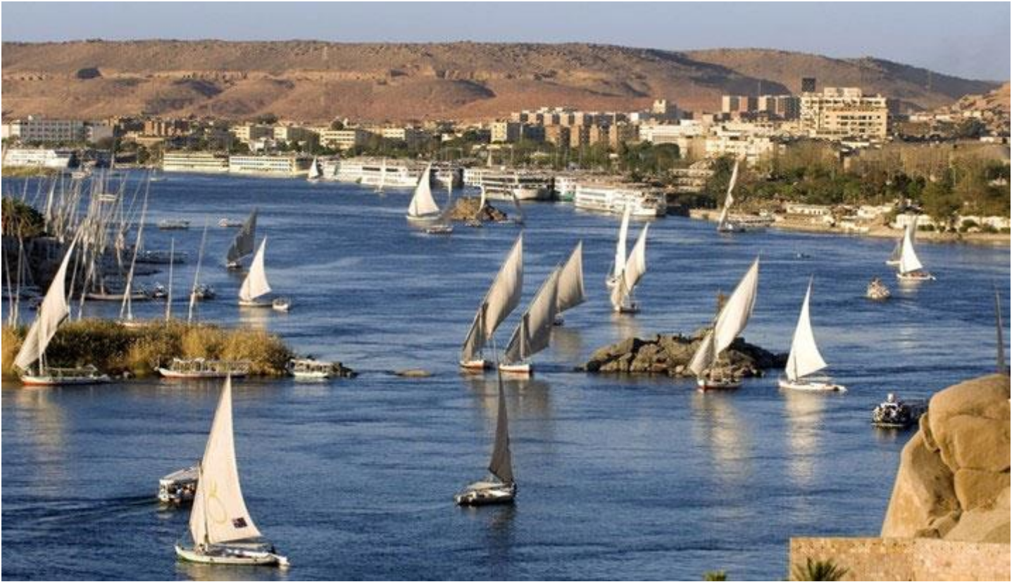
🚢 แพคเกจเรือแม่น้ำไนล์ระดับ 5 ดาว SOLARIS NILE CRUISE https://www.solarisnilecruises.com