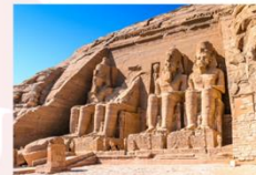
มหาวิหารอาบูซิมเบล

** พักที่ JAZ Crown Jewel Nile Cruise 4* หรือเทียบเท่า **