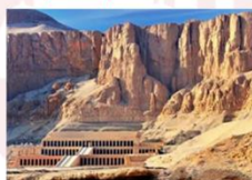
วิหารฮัคเซฟซุต

** พักที่ JAZ Crown Jewel Nile Cruise 4* หรือเทียบเท่า **