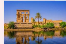
วิหารฟิเล

16.25 น. ออกเดินทางสู่กรุงโคโร สายการบิน Egypt Airlines เที่ยวบิน MS295