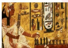
หุบผากษัตริย์

** พักที่ JAZ Crown Jewel Nile Cruise 4* หรือเทียบเท่า **