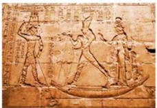
วิหารเอ็ดฟู