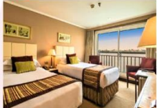
เรือสำราญแม่น้ำไนล์

** พักที่ JAZ Crown Jewel Nile Cruise 4* หรือเทียบเท่า **