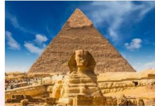
มหาพีระมิดกษัตริย์