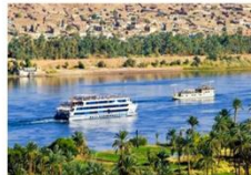
พักผ่อนตามอัธยาศัย บนเรือสำราญ

** พักที่ JAZ Crown Jewel Nile Cruise 4* หรือเทียบเท่า **