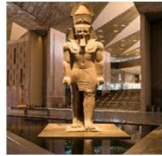
The Egyptian Museum

** พักที่ Mamlouk Pyramids Hotel 4* หรือเทียบเท่า **