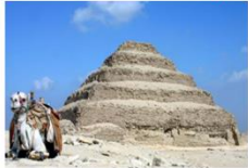
พีระมิดชั้นบันได