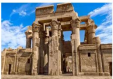
วิหารคอมมอโบ