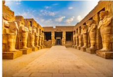
มหาวิหารคาร์นัค

** พักที่ JAZ Crown Jewel Nile Cruise 4* หรือเทียบเท่า **