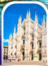
DUOMO MILAN ITALY