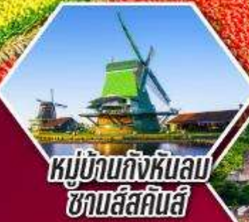
หมู่บ้านกังหันลม ซานส์สคินส์