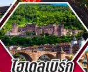
ไฮเดลเบิร์ก