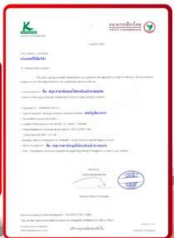
ตัวอย่าง Bank Guarantee ที่ผู้สมัครต้องยื่นเอกสาร