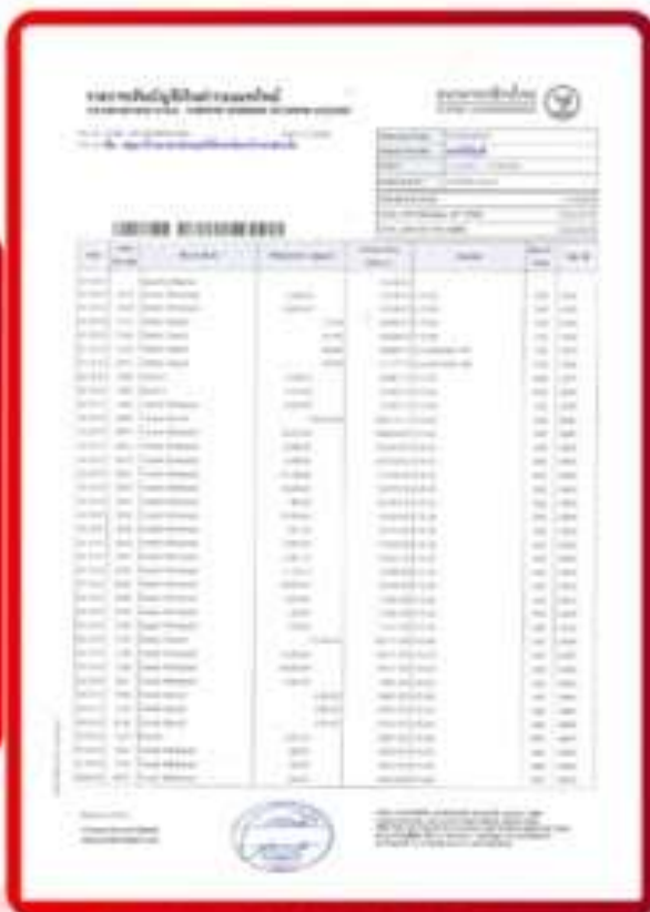
ตัวอย่าง Bank Statement ที่ผู้สมัครต้องยื่นเอกสาร

3.4 ปรับสมุดบัญชีธนาคารตัวจริง และเตรียมไปในวันที่ยื่นวีซ่า