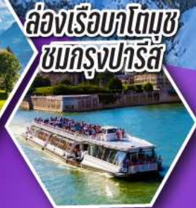
ล่องเรือบาโตมุซ ชมกรุงปารีส

เที่ยวเมืองวาอุซ เมืองหลวงของสาธารณรัฐ ลิกเทินสไตน์