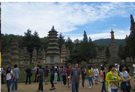
ป่าเจดีย์