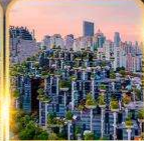
Tian An 1000 Trees