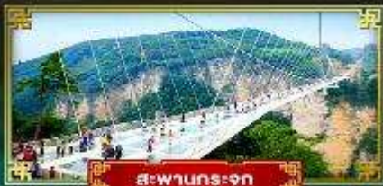
สะพานกระจก

สัมผัสบรรยากาศหมู่บ้านโบราณ ชมหุบเขาอวตาร