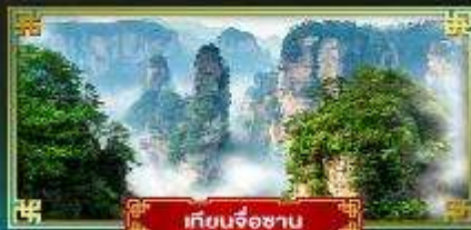
เทียนจ้อซาน