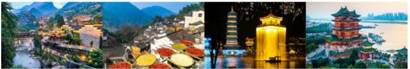
หุบเขาเทวดาฉีเจียนกู่