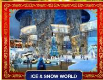
ICE & SNOW WORLD