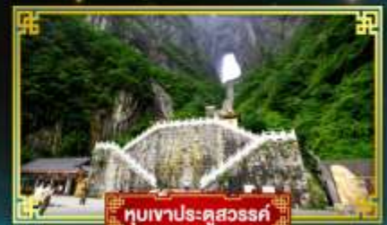
อุทยานประตูสวรรค์