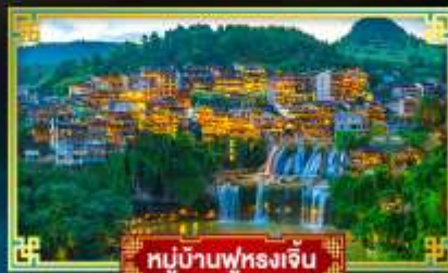
หมู่บ้านฟุรงเจิน