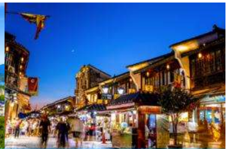
ย่านเหอฝางเจีย