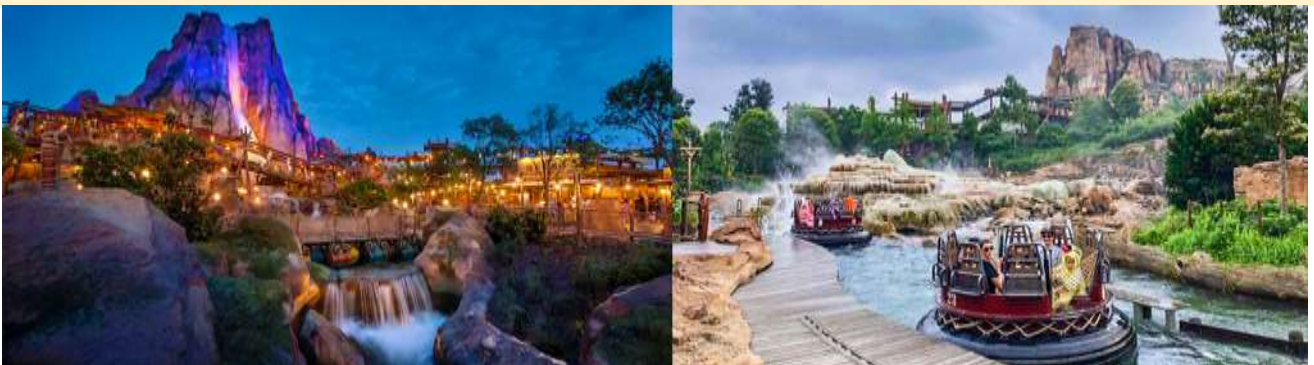
สวนสนุกเซี่ยงไฮ้ดิสนีย์แลนด์ ประกอบด้วย 6 ธีมปาร์ค และ 1 ฟรีโซน

กลางวัน อิสระอาหารมื้อกลางวัน เพื่อความสะดวกในการเล่นเครื่องเล่นอย่างเต็มที่