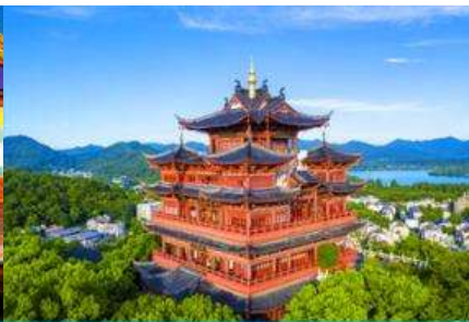
หอเจิงหวงเก้อ