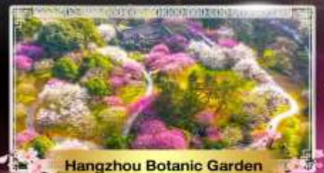
Hangzhou Botanic Garden