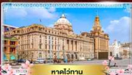
หาดไถ่ทาน

"ชมดอกซากุระนลิบาน ณ แดนมังกร" ล่องเรือทะเลสาบตะวันตก ไข่มุกแห่งหางโจว