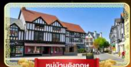
หมู่บ้านอังกฤษ