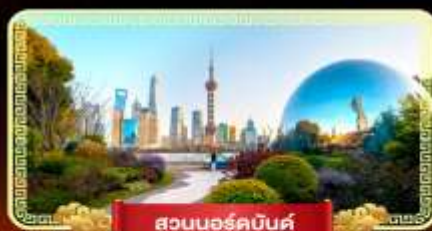
สวนนอร์คบันด์