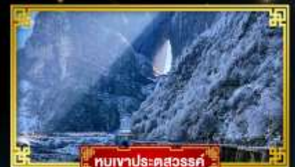
ทิวเขาประตูละคร