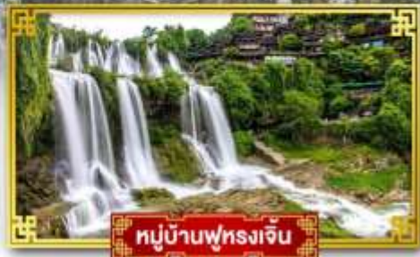
หมู่บ้านฟุทงเจิ้น