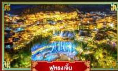
ฟูหลงเจิ่น