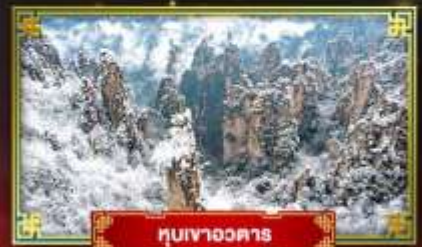
ทวนเขาฉงตาร