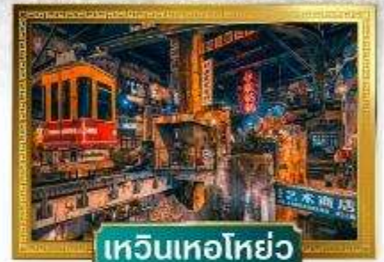
เหวินเหอโฮ่ย