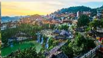
เมืองโบราณฝูหลงเจิน