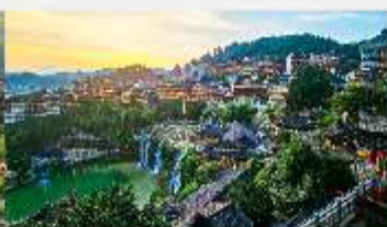
เมืองโบราณฟูหรงเจิน