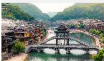
เมืองโบราณเฟิ่งหวง