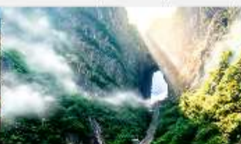
ประตูสวรรค์