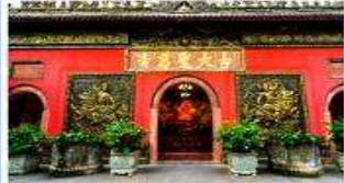
วัดต้าเจี๋ย