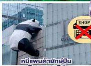
หมีแพนด้ายักษ์ปักกิ่ง ตึกถนนซุนซีตู้