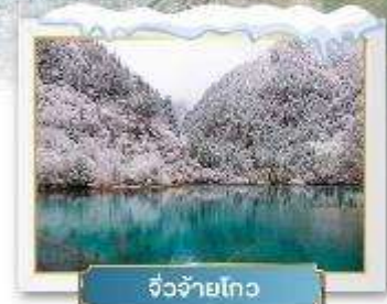
จิวจ้ายโก