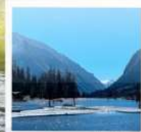
อุทยานชวงเฉียวโกว