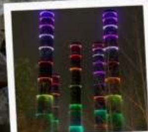
แสงสี ห้าง SKP