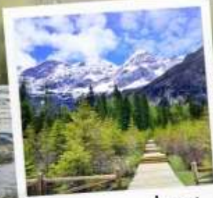
อุทยานภูเขาสี่ตรุณี