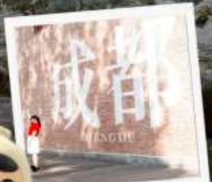
CHENGDU EASTERN MEMORY