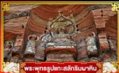
พระพุทธรูปแกะสลักหินผาศิน