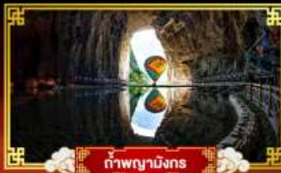
กำแพงสามผา