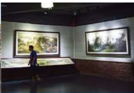
พิพิธภัณฑ์ภาพหินทราย