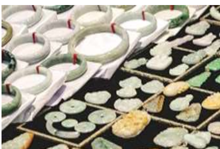
ศูนย์จำหน่ายผลิตภัณฑท์หยก

อัตราค่าบริการสำหรับโปรแกรมเสริมการแสดงชุด The love Story of Wooden man and Fairy Fox ท่านละ 400 หยวน (หรือ 2,000 บาทขึ้นอยู่กับอัตราแลกเปลี่ยน) ระยะเวลาที่ใช้ในการเที่ยวชมการแสดง ประมาณ 3 ชั่วโมง รวมเวลาเดินทางไป กลับค่าบริการรวม ค่าบัตรเข้าชม ค่ารถรับ ส่ง และค่าน้ำเที่ยวของไกด์ท้องถิ่น พักที่ ZHENMIAN HOTEL โรงแรมระดับ 4 ดาวหรือเทียบเท่า