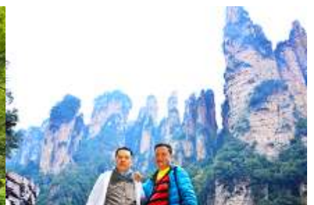
ชมจุดชมวิวลีฟก้าแก้ว