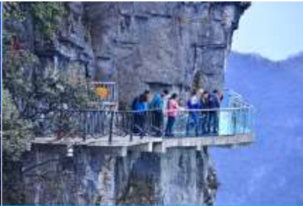
หน้าผาลอยฟ้าทางเดินกระจก