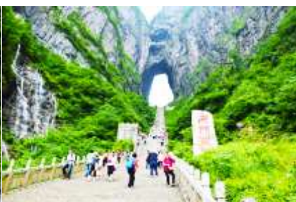
บันได 999 ขั้น