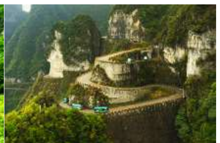
เส้นทาง 99 โค้ง