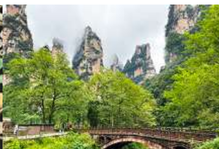
จุดชมวิวจินเปียนซี