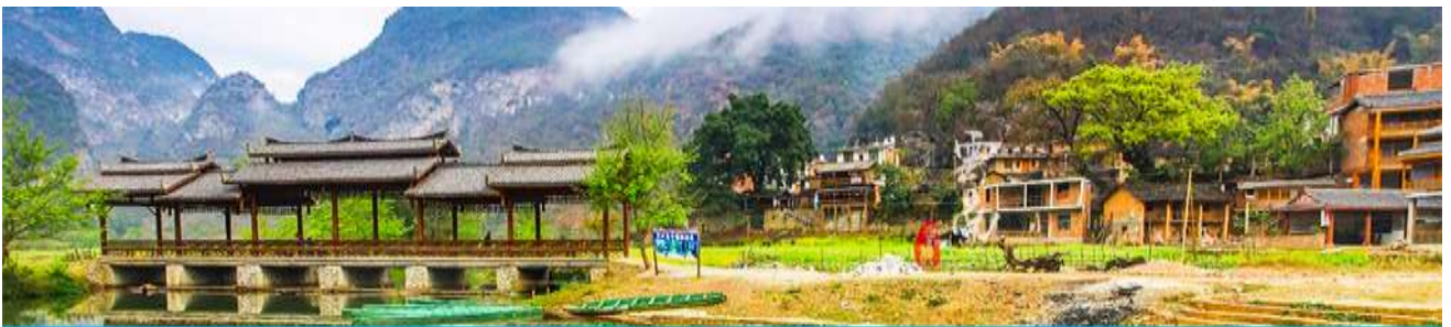
สวนดอกท้อ