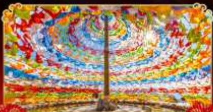
รมณต์อริชชาน