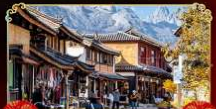
เมืองเก่าไปซา