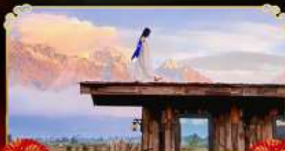
YUN TI YANG CAFE