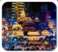
"วัดจิ่งอัน"