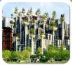
"อาคารพินตันไม้"