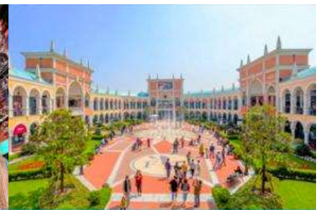
Florentia Village Outlet