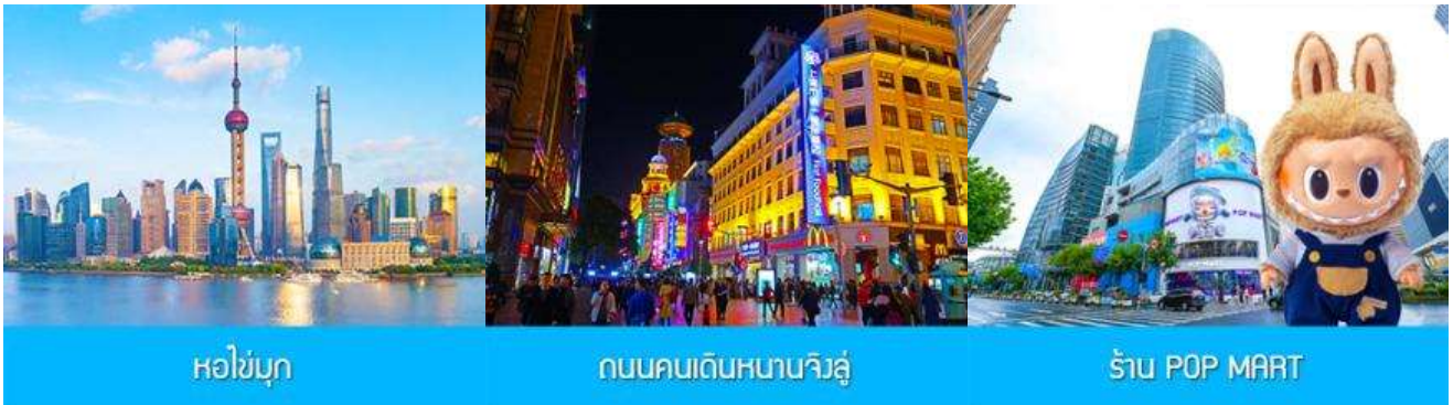
หอไข่มุก