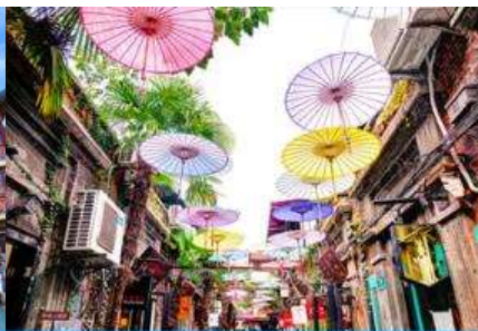
ย่านเกียบจื่อฟา