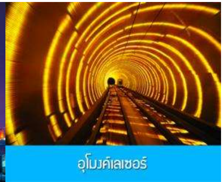
อุโมงค์เลเซอร์

ไกด์ขายออฟชั่น ล่องแม่น้ำหวงผู่ ชมแสงสียามค่ำคืน และอุโมงค์เลเซอร์ลอดแม่น้ำ รวมอาหารค่ำ สุกี้หม่าล่า ราคา ท่านละ 480 หยวน (หากจำนวนไม่ถึง 8 ท่าน ไกด์ไม่สามารถจัดได้)