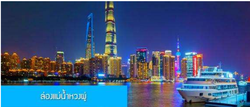
ล่องแม่น้ำหวงผู่