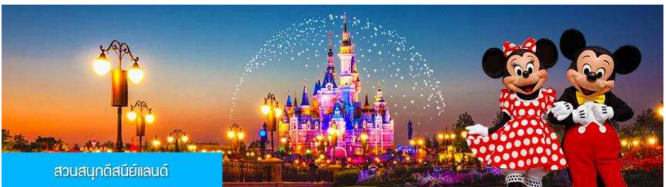
สวนสนุกดิสนีย์แลนด์

พักที่ โรงแรม Luna Garden Hotel or Holiday Inn Express Hotel 4* หรือเทียบเท่าในเมืองเซี่ยงไฮ้