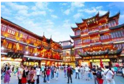
ตลาดร้อยปีเฉิงหวงเมี่ยว

พักที่ โรงแรม Luna Garden Hotel or Holiday Inn Express Hotel 4* หรือเทียบเท่าในเมืองเซี่ยงไฮ้