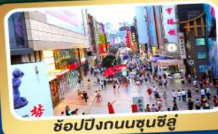
ช้อปปิ้งถนนชุนชี่อู๋