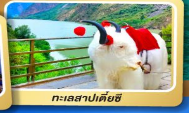
ทะเลสาปเตี้ยชี่