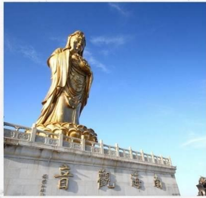
เกาะผู้ไถวซาน