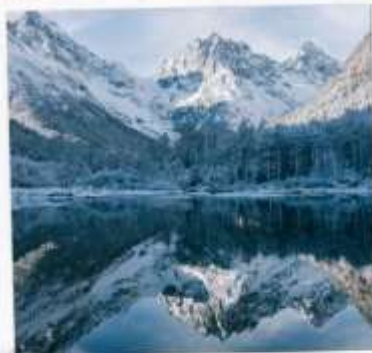
อุทยานปีศาจโกว