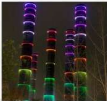
ชมแสงสีห้าง SKP