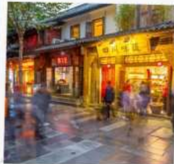
ถนนชอยกว้างแคบ