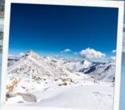
ภูเขาหิมะการ์เซีย ท่ากู่ปิงชวน