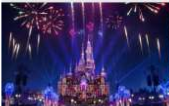
เซียงโฮ้ตีสันย์แลนด์