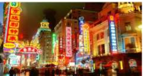
ถนนนานกิง

*ทางบริษัทฯ ขอสงวนสิทธิ์ในการสลับโปรแกรมทัวร์ตามความเหมาะสมขึ้นอยู่กับสถานการณ์หน้างาน โดยคำนึงถึงผลประโยชน์ของลูกค้าเป็นสำคัญ