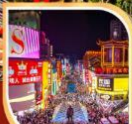
ถนนคนเดิน หวงซิงลู่