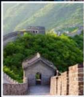
กำแพงเมืองจีน มู่เทียนยวี