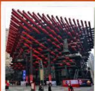
พิพิธภัณฑ์ศิลปะฉงชิ่ง