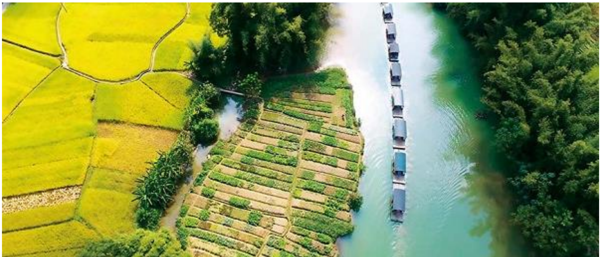
Bamboo rafts line up on the river in the Mingshi tourist resort.

รถบัสนำท่านไปส่งที่ท่าแพต้นน้ำ เพื่อให้ท่าน ลงแพไม้ไผ่หมิงชื่อเถียนเหยียน ชมทัศนียภาพสองฝั่งลำน้ำ และบรรยากาศอันสดชื่นที่มีภูเขาที่เป็นฉากหลัง ที่เรียกว่า "วิวภาพเขียนร้อยสี" วิวนี้โด่งดังเพราะ มีซีรีส์ทีวี "ฮวาเซียนกุ" มาถ่ายทำที่นี่ ขณะลงแพท่านจะได้พบเห็นวิถีชีวิตของชาวฉางชนบท ที่ออกมาทำกิจกรรมประจำวัน เมืองฉิงซีมีอากาศเย็นสบายและมีทัศนียภาพทางธรรมชาติสวยงามคล้ายเมืองกุ้ยหลิน