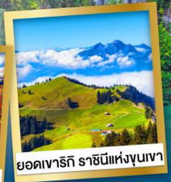
ยอดเขารัก ราซินีแห่งขุนเขา