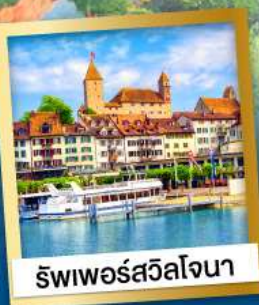
ริพเพอร์สวิลล์