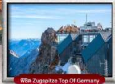
พิกัด Zugspitze Top Of Germany