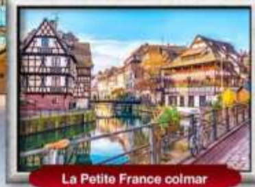
La Petite France colmar

บินหรู สายการบิน Full Service | พิเศษ! หอยแอสคาโก้